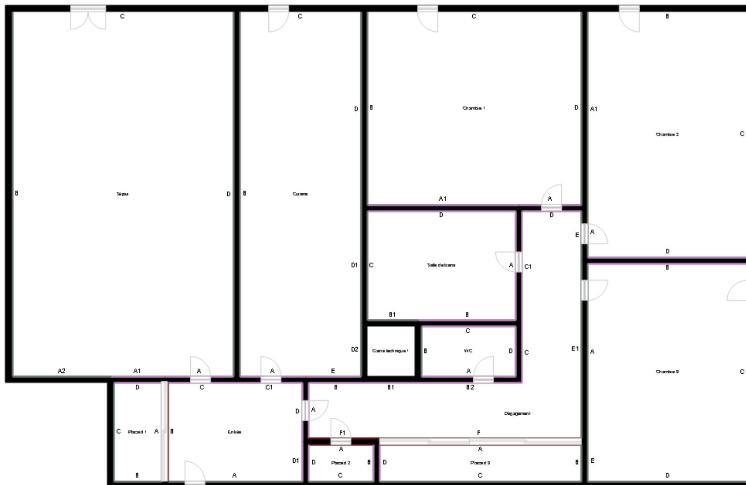
PLANCHE DE REPERAGE

Bien : 244LAA0001 - LOGT 1 1 ALLEE DE LA JUSTICE 77440 LIZY SUR OURCQ